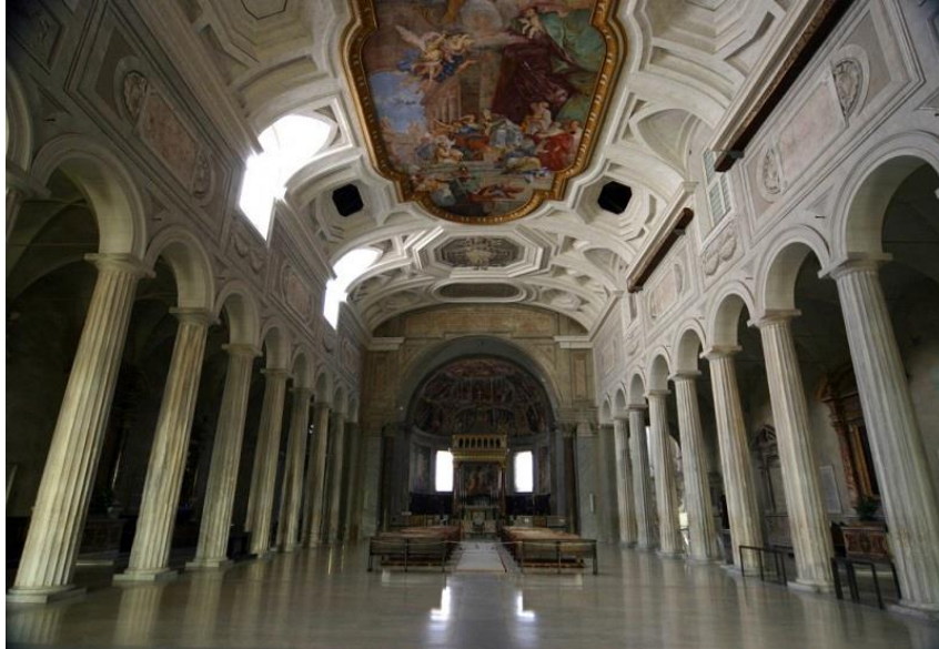
Ναός του αγίου Πέτρου στη Ρώμη, εσωτερικό