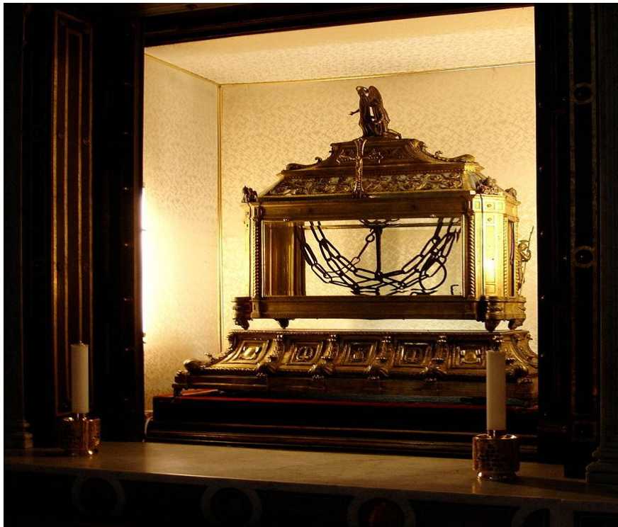
Ἡ ἄλυσος τοῦ ἀγίου Πέτρου στὴ Ῥώμη ( https://choratouaxoritou.gr/?p=45830&cn-reloaded=1 )

Σύνδησον ἀγάπη εἰλικρινεῖ, Πέτρε κορυφαῖε, ὁ φιλήσας Χριστὸν θερμῶς, τοὺς τὴν Ἄλυσίν σου σεμνῶς ἀσπαζομένους, Ἀπόστολε θεόπτα, καὶ σέ δοξάζοντας.